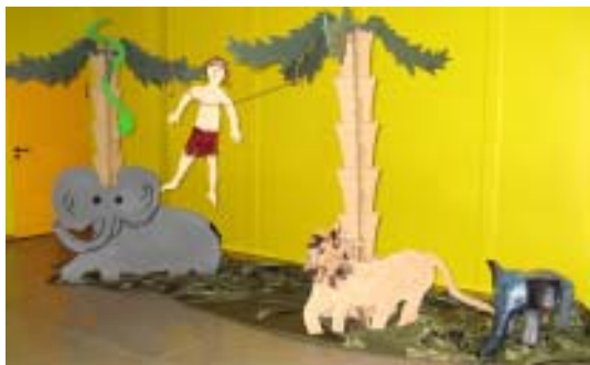
Urwaldstimmung in der Cafeteria